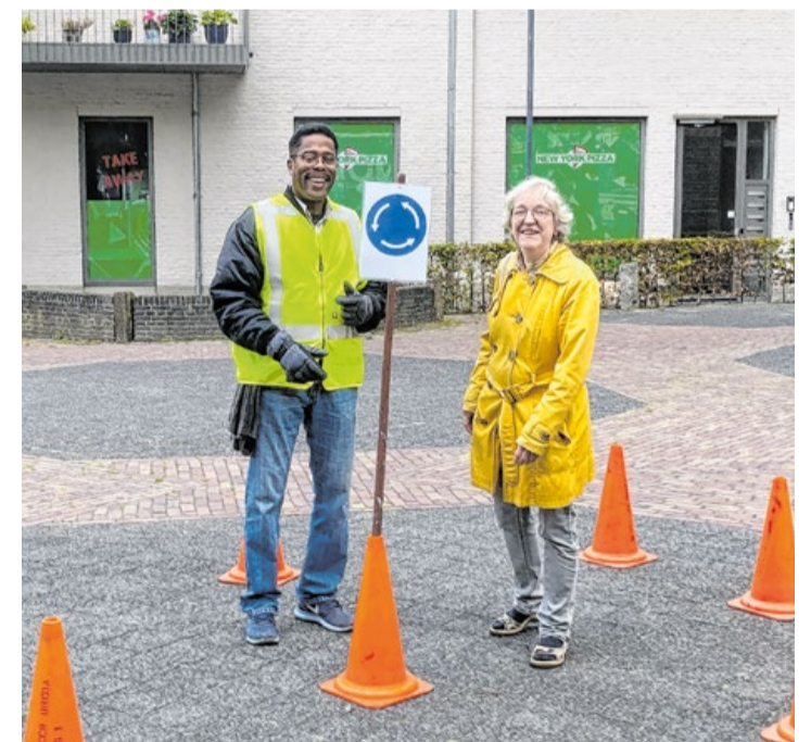
We hadden een rotonde uitgezet zodat iedereen die per auto aankwam snel en efficiënt geholpen kon worden

Hartelijk dank aan iedereen die hieraan heeft bijgedragen. Caritas Parochie Heilige Geest