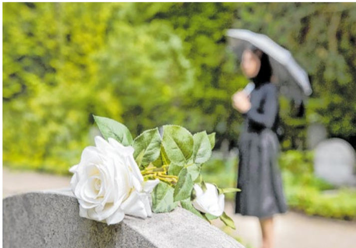
Aan Gods licht toevertrouwd

Op 1 november viert de Kerk Allerheiligen, wij gedenken allen die voor eeuwig leven bij God, of zij nu heilig verklaard zijn of niet. Wij bidden op voorspraak van de heiligen in de hemel, dat zij ons willen helpen in dit leven. De heiligen zijn de bemiddelaars en voorsprekers van ons in de hemel. Wie is uw favoriete heilige?