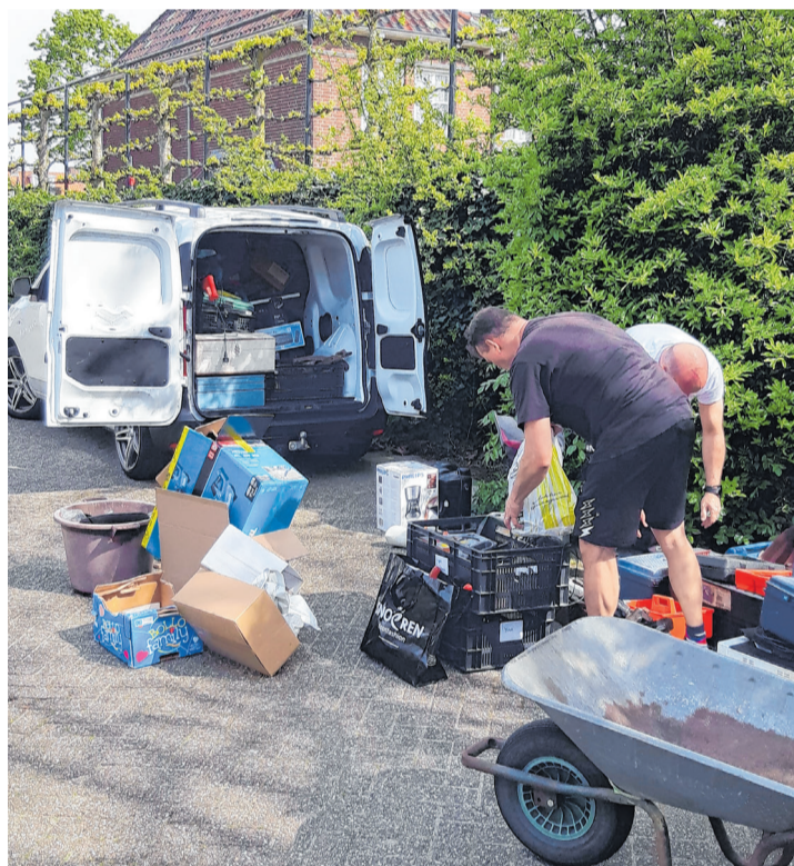
De bus van de Weggeefhoek meer dan vol

Zaterdagochtend 13 april was het weer zover. Met Caritas organiseerden we de kledinginzameling voor Sam's Kledingactie en een inzameling van gereedschap voor Weggeefhoek Gilze-Rijen. En dit keer hadden we in Molenschot ook een inleverpunt voor kleding en gereedschap. De weergoden waren ons gunstig gezind. En gelukkig wisten er weer veel mensen de weg te vinden en stroomden de zakken kleding en schoeisel binnen. We waren positief verast met de grote hoeveelheid gereedschap, die zoveel mensen bij ons af kwamen geven. Twee keer de bus van Weggeefhoek vol plus nog een aanhanger met gereed-