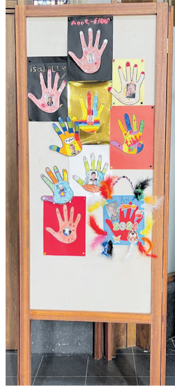
Voorbereiding Eerste Communie: 'Geef me de vijf'