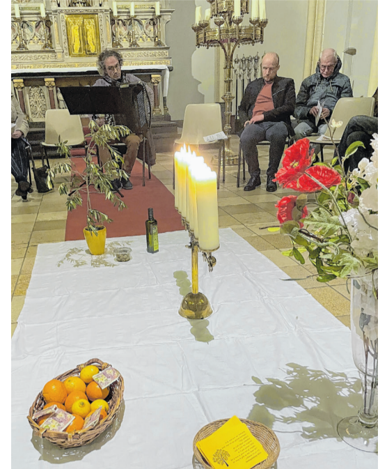
In het midden van de kring bijzonderheden uit Palestina

In de Maria Magdalenakerk werd de avond voortgezet met een viering. Luisterend naar drie verhalen van vrouwen uit Palestina werd er wereldwijd en zo ook in Rijen gebeden om vrede. In het midden van de kring verwees de schikking naar Palestina. Olijftakken verwezen naar olijfbomen, teken van overvloedig leven in vrede. Jasmijnthee die troost brengt en mensen bij elkaar brengt. Citrusfruit dat er van oudsher groeit en klapprozen die herinneren aan de mensen die zijn gestorven. Dat alles op een wit kleed dat verwijst naar de traditionele witte sjaal die vrouwen dragen. Al luisterend en biddend groeide het licht op de zevenarmige kandelaar als een smeekgebed om vrede: ik smeek u, verdraag elkaar in liefde. Wat prachtig om Wereldgebedsday zo te kunnen vieren.