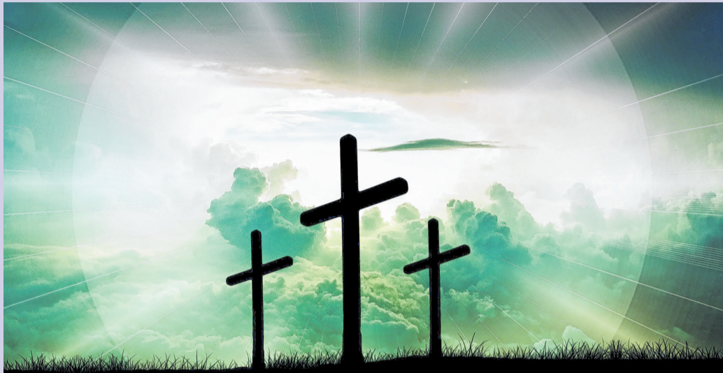
Pasen, heb jij het al meegemaakt?