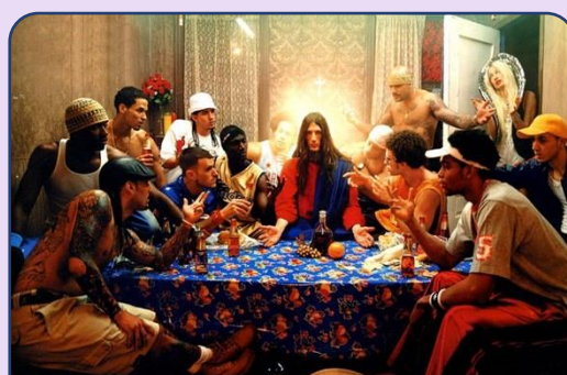
Het Laatste Avondmaal voor iedereen