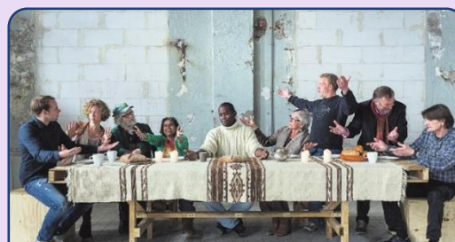
Daklozen beelden het Laatste Avondmaal uit

God, barmhartige Vader, in de Goede Week die voor ons ligt, gaan we mee in een stroom van gebeurtenissen. U heeft ons in het lijden van Jezus Christus een voorbeeld van Uw liefde gegeven; geef ons ook de rijke gave van Uw zegen.