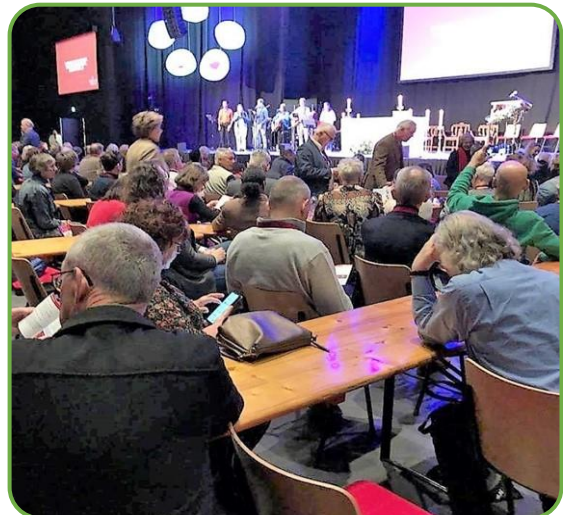
Parochianen tijdens een bijeenkomst over de Missionaire Kerk in Veenendaal

Het evangelie van Hemelvaart is de opdracht geworden van het verlangen naar missionaire parochies in ons Bisdop. Ook onze parochies hebben gekozen voor deze missionaire opdracht. Maar het probleem wordt door veel parochianen ook gevoeld: 'Mensen tot leerlingen maken', dat klinkt geforceerd. Alsof je wil forceren dat een ander gelovig wordt. Dat willen we niet. En terecht! Dat moeten we ook niet willen. Maar wat we ook niet willen: Met zijn allen naar de hemel gaan staren, ons opsluiten in onze eigen kring of het geloof veilig bewaren in een oude dekenkist op de zolder. Wanneer we deze wereld de blijde boodschap willen brengen, zullen we bij onszelf en bij onze eigen parochie moeten beginnen: werk maken van ons eigen geloof, ons eigen doen en laten, ons spreken en zwijgen. En als een vanzelfsprekendheid mogen we delen van de evangelische vreugde die we opdoen: Als gezonden troost brengen, bemoedigen, mensen recht doen, verschillen overbruggen. Wie zo in het leven staat, kan een gelukkig mens zijn, omdat hij er voor anderen is.