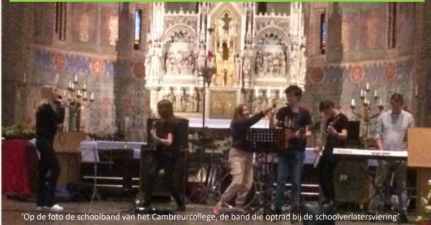
‘Op de foto de schoolband van het Cambreurcollege, de band die optrad bij de schoolverlatersviering’

De parochie biedt scholen –waar het kan- graag de gelegenheid om voor eigen vieringen gebruik te maken van de kerk. Te denken is daarbij aan vieringen bij de opening van het schooljaar, Kerstmis en Pasen. Het pastoresteam is bereid om daarin ook te participeren bij de voorbereiding en de uitvoering, maar scholen kunnen vieringen ook geheel zelfstandig organiseren.