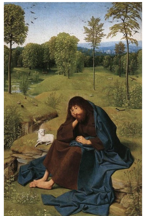
Sint Jan de Doper met het Lams Gods

Nu wij deze adventstijd beleven en het weer kerstmis wordt, spreek ik de bede uit dat het temperament van Johannes de Doper ons allen mag bezielen.