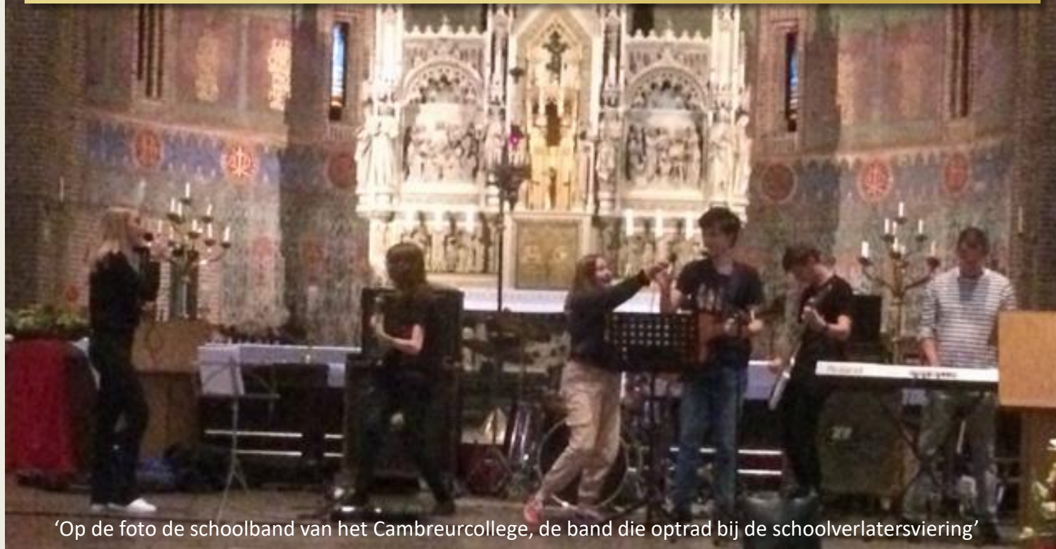
‘Op de foto de schoolband van het Cambreurcollege, de band die optrad bij de schoolverlatersviering’

De parochie biedt scholen –waar het kan- graag de gelegenheid om voor eigen vieringen gebruik te maken van de kerk. Te denken is daarbij aan vieringen bij de opening van het schooljaar, Kerstmis en Pasen. Het pastoresteam is bereid om daarin ook te participeren bij de voorbereiding en de uitvoering, maar scholen kunnen vieringen ook geheel zelfstandig organiseren.