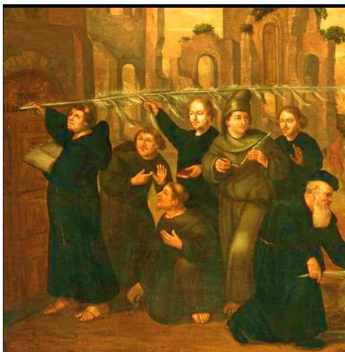
Droom van de keurvorst van Saksen, Jan Barentsz Muyskens, 1643