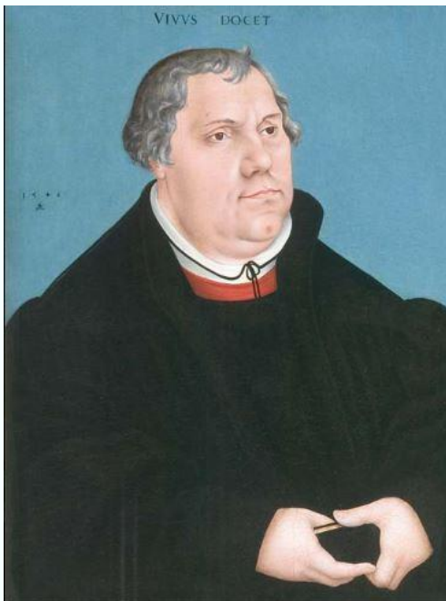
Portret van Maarten Luther, 1483-1546, Lucas Cranach, 1546

U kunt zich tot zondag 12 november opgeven bij het secretariaat van uw parochie of gemeente. Neem uw legitimatiebewijs mee voor de juiste gegevens voor de treinreis. U kunt zich ook aanmelden via email: teamassistente@parochiedongen.nl