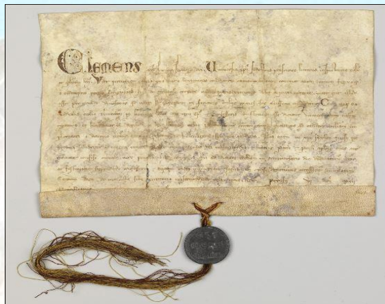
Aflaatbrief met pauselijke toestemming van Clemens IV voor de verkoop van aflaten